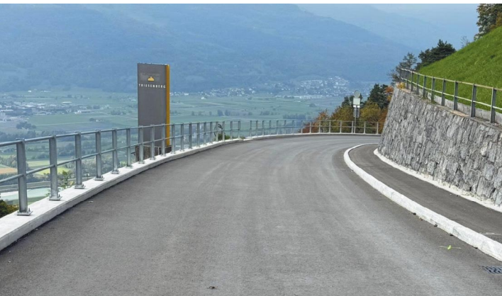
Die Bauarbeiten an der Schlossstrasse sind abgeschlossen.

Uhr, bis Mitte Dezember für den motorisierten Verkehr vollständig gesperrt. Aber auch für Fussgänger und für Radfahrer ist die Strasse gesperrt. Eine Umleitung über die Bergstrasse wird entsprechend signalisiert. «Die Bauherrschaften sowie alle beteiligten Unternehmen sind bemüht, die Arbeiten so zügig wie möglich auszuführen und danken Ihnen bereits im Voraus für ihr Verständnis», heisst es in einer Mitteilung vom ATG. (red)