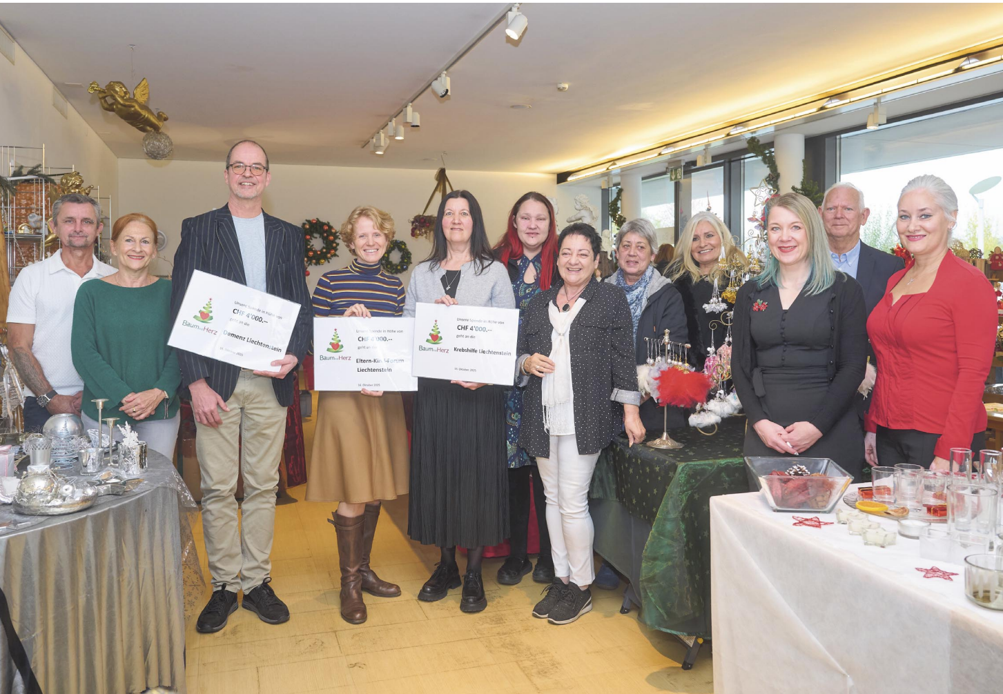
Das Team von «Baum mit Herz» hat insgesamt 12 000 Franken an drei soziale Institutionen gespendet. Am kommenden Montag startet zudem der Verkauf in neuen Räumlichkeiten.